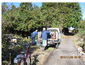
不法投棄場所でのコマ