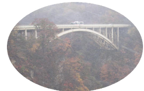
雪が降りしきる鳴子峡