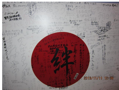
石巻港のカマボコ工場に張られてた寄せ書きです。 応援メッセージがびっしり書き込まれておりました。