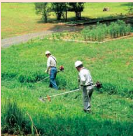
[小幡北山埴輪公園草刈作業]