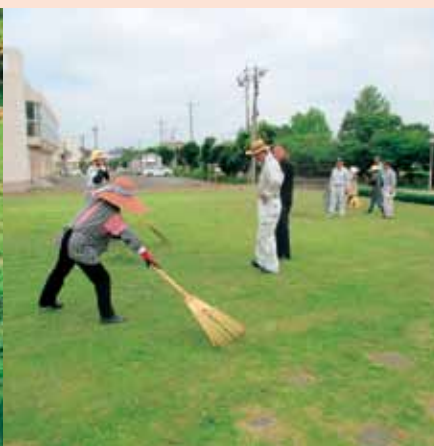
[役場庁舎敷地集積作業]